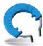
POY021 myRing Classico, 1 uds.,